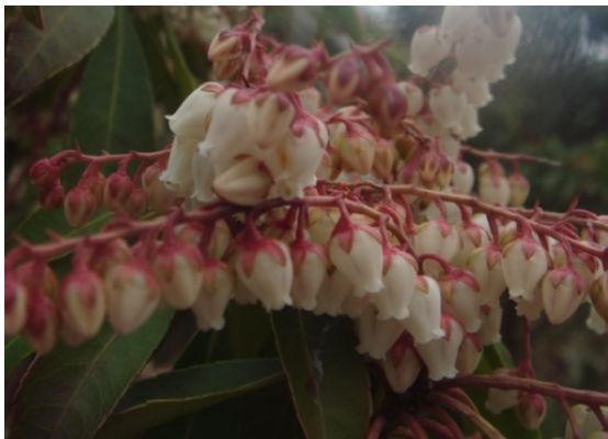
↑ 雌岳山頂のアシビ