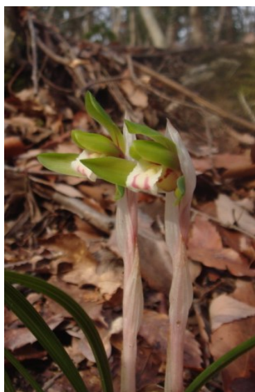
シュンラン (二上山で)

林道脇にはマンサク、ウグイスカグラ、アオモジ、スマイレなど早春の花が咲いていて楽しい散策路だ。公苑～済浄坊の滝までゆったりと歩いて往復2時間余。路傍の花の種類も増すだろうし、当日を楽しみに待つことにしよう。